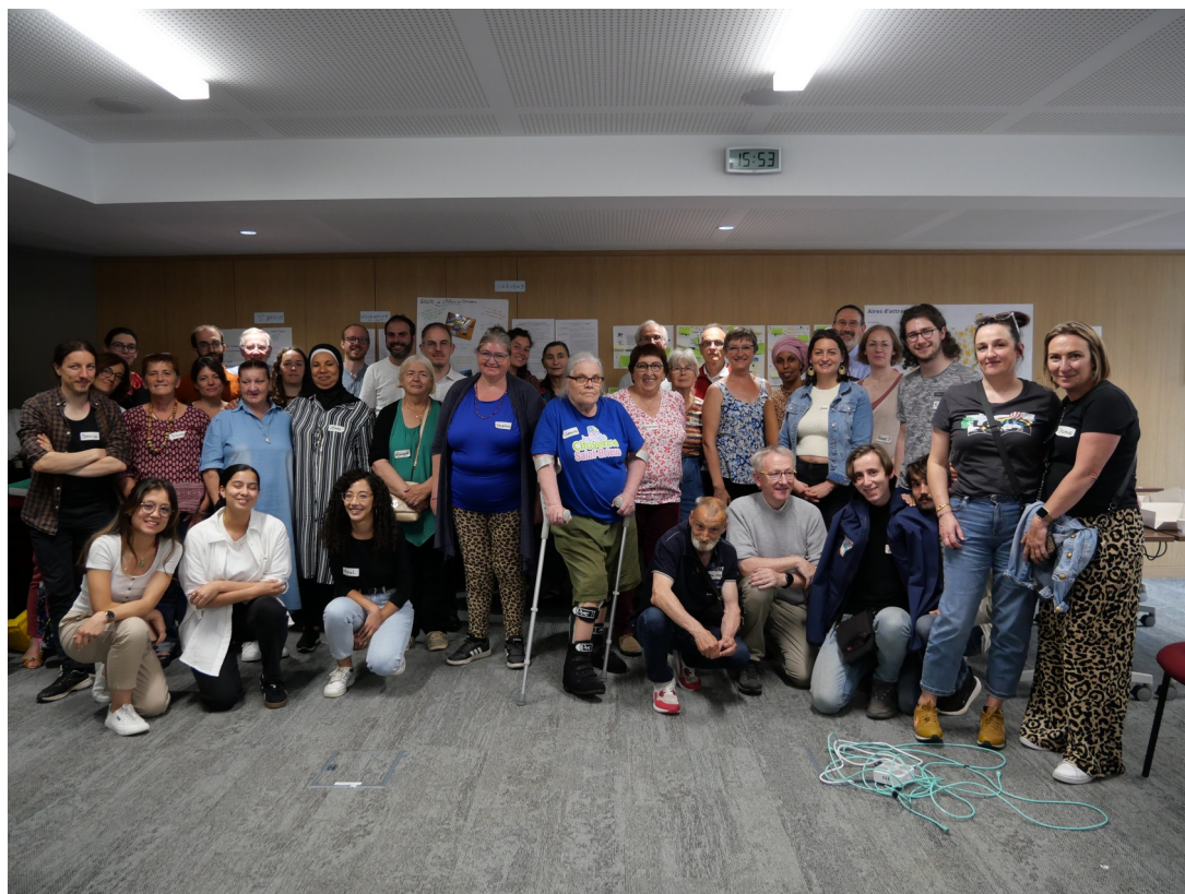
Photo de groupe dans les locaux de l'Insee le 1er juillet 2024