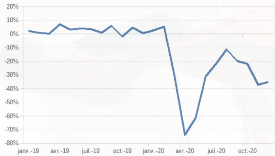
Évolution des déclarations préalables en l'embauche par rapport à l'année précédente en Provence-Alpes-Côte d'Azur

Une partie de ces étudiants, qui dépend financièrement de ces emplois, s'en trouve très probablement affectée.