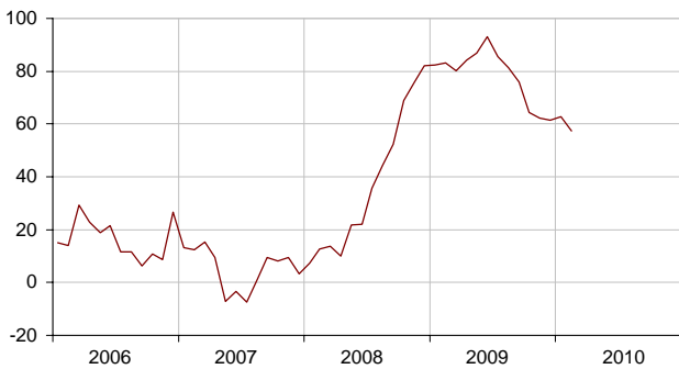
Soldes de réponses CVS, en points