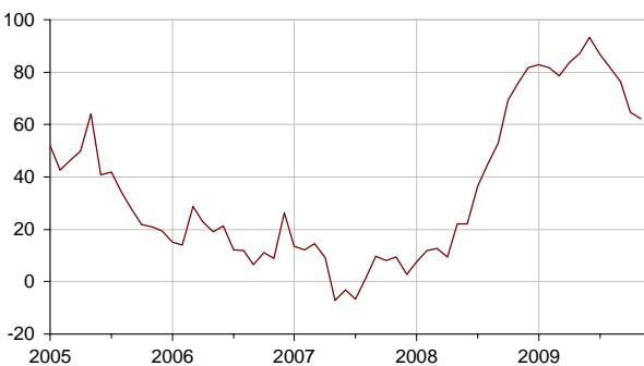
Soldes de réponses CVS, en points

L'opinion des ménages sur leur situation financière actuelle remonte en novembre (+5 points).