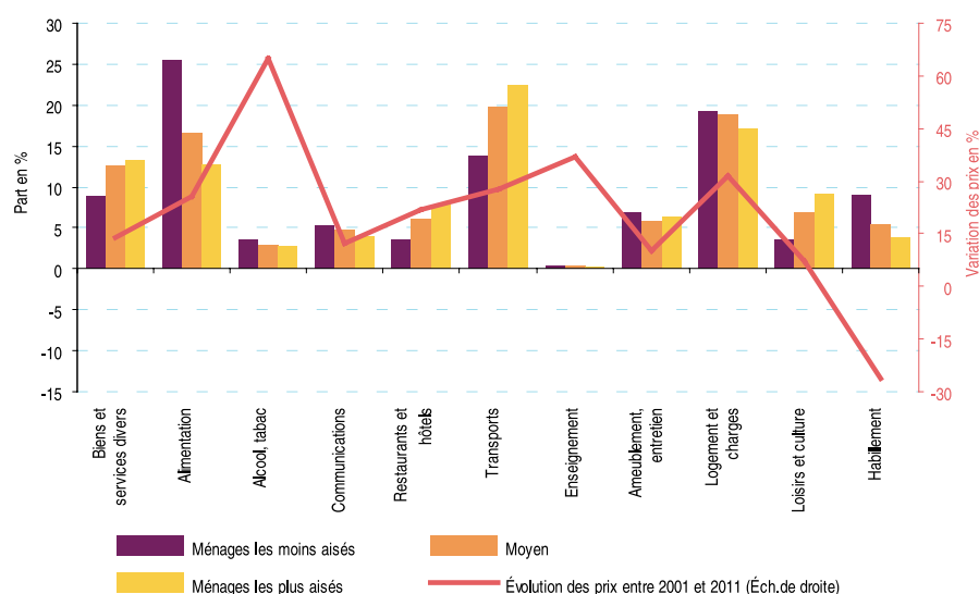
Part et évolution des différents postes de la consommation des ménages (en % et en point)