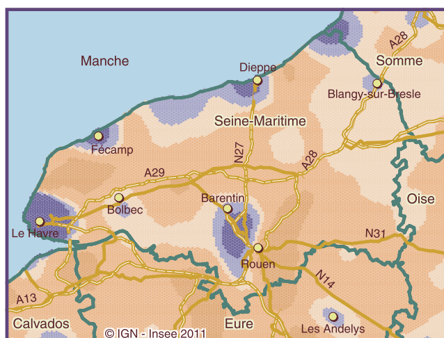
Variation de densité de population lissée entre 1999 et 2008