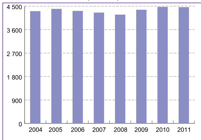
Nombre de nuitées par mois Saison 2011