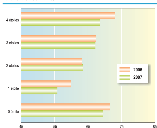
Taux d'occupation des hôtels bretons par catégorie durant la saison (en %)