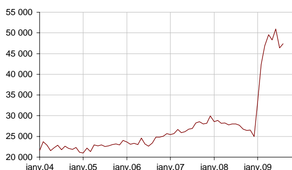
Créations d'entreprises – Données CVS-CJO *