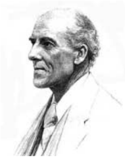
Karl Pearson, 1857-1936