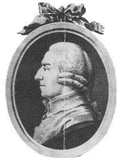
Adam Smith, 1723-1790