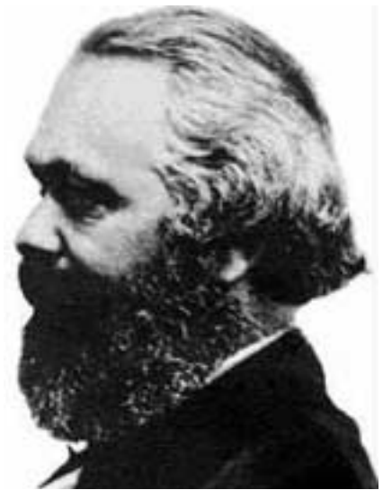
Karl Marx, 1818-1883

La grande crise des années 1930 a été souvent perçue, à l'époque, comme une crise de l'économie de marché classique. Elle a été à l'origine de réflexions et de propositions nouvelles sur le rôle de l'État. Ces idées peuvent, en simplifiant, être réparties en deux groupes : le planisme et le keynésianisme. L'idée de plan , bien sûr poussée à l'extrême et réalisée dans le cas de l'Union soviétique, a été pourtant, dans les années 1930, discutée par des économistes et des philosophes politiques répartis sur tout l'éventail politique, de la droite corporatiste à la gauche socialiste, en passant par des réformateurs chrétiens, catholiques ou protestants, notamment en Europe occidentale. Le point commun à ces courants de pensée, par ailleurs très différents, était une hostilité au libéralisme économique, fondée, selon les cas, sur des bases nationalistes, humanistes ou marxistes. En cela, le planisme se distinguait du keynésianisme qui, lui, ne mettait pas en cause l'économie