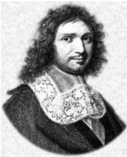
Jean-Baptiste Colbert, 1619-1688

Cette configuration a une longue histoire. L'État se substitue directement, pour des raisons variées, à l'initiative privée. Colbert a fondé, dans la France du XVIII e siècle, des manufactures royales, pour la construction navale et la tapisserie. Pierre le Grand a créé une industrie en Russie. L'École polytechnique française formait des « ingénieurs d'État » (mines, ponts et chaussées, armement) habitués à diriger des pans entiers de l'économie en privilégiant largement des logiques techniques plutôt que marchandes 2 .