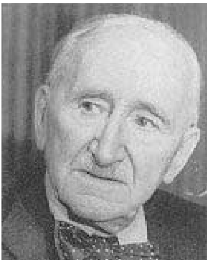
Friedrich August von Hayek, 1889-1992 Prix Nobel d'économie 1974

Pourtant, nombreuses ont été les institutions et les opérations statistiques directement justifiées par les besoins d'une économie marchande. Les premiers exemples en ont été fournis par l'existence du commerce international, des tarifs douaniers,