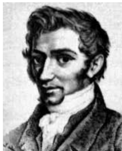
Adolphe Quételet, 1796-1874

Or, au nouvel État providence, est associée l'idée d' assurance . Une procédure basée sur un calcul statistique assure la couverture des risques, sur la base des probabilités (mesurées par des fréquences) des divers événements décrits par la nouvelle sta-