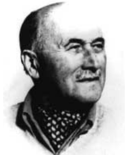
Jean Monnet, 1888-1979

Dans le cas de la France des années 1950 à 1970, ces deux formes d'action et de description économique ont été imbriquées. Un « Commissariat général du Plan » a été créé en 1945