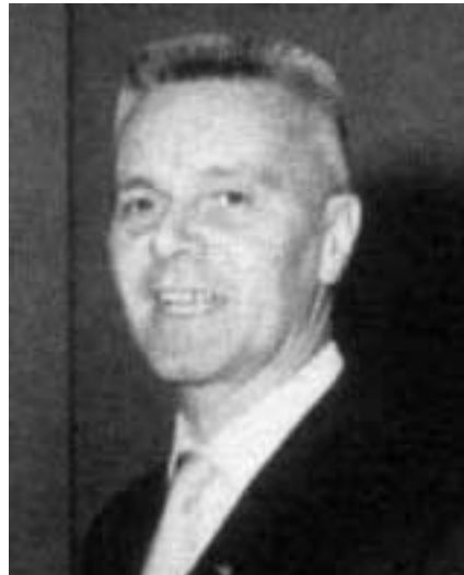
Jan Tinbergen, 1903-1994 Prix Nobel d'économie 1969

le plan néerlandais a développé de nouvelles formes de ces modèles, mais aussi que ceux-ci ont été largement utilisés dans le débat social et