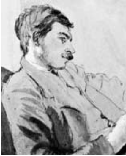
Lord John Maynard Keynes, 1883-1946

mais qu'elle a été rapidement rendue opératoire, grâce aux tableaux de la comptabilité nationale , et aux séries décrivant les liens entre les évolutions des diverses composantes de cette offre et de cette demande. Ainsi, là encore, étaient co-construits un État doté d'une responsabilité nouvelle (celle de piloter l'équilibre macroéconomique, tout en respectant le caractère marchand de l'économie) et un mode de description et d'analyse nouveau, la comptabilité nationale et les modèles macroéconométriques, tels que celui construit aux Pays-Bas par Jan Tinbergen (1903-1994), dès les années 1930 13 .